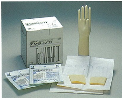
TechWRAP II (パウダー付)