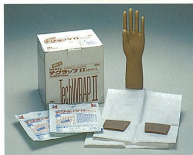
TechWRAP II Super (パウダーフリー)

■パウダーフリーとパウダー付の2タイプがあります。 テクラップ® IIシリーズは、袖口にしっかりフィットさせ るようカフを厚く・長くし、繊細な感触が要求される 指先を薄く仕上げています。また、マイクロ粗面仕上 げにより確実なグリップ感が得られます。 テクラップ® IIシリーズは徹底した洗浄を行うことで、 ラテックスアレルギー原因物質の含有量を低減させ ています。